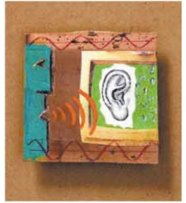
Escuchar un arte ... un don.

"Esta es una Campaña sin costo alguno dirigida a personas de escasos recursos, con pérdida auditiva importante, quienes serán atendidos gratuitamente por el equipo médico conformado por profesionales de la Clínica Yepes Porto, el Hospital Militar y la Clínica San Rafael (Bogotá), quienes con sus conocimientos y experiencia, podrán devolver la audición a los pacientes de la Costa Caribe que así lo necesiten.